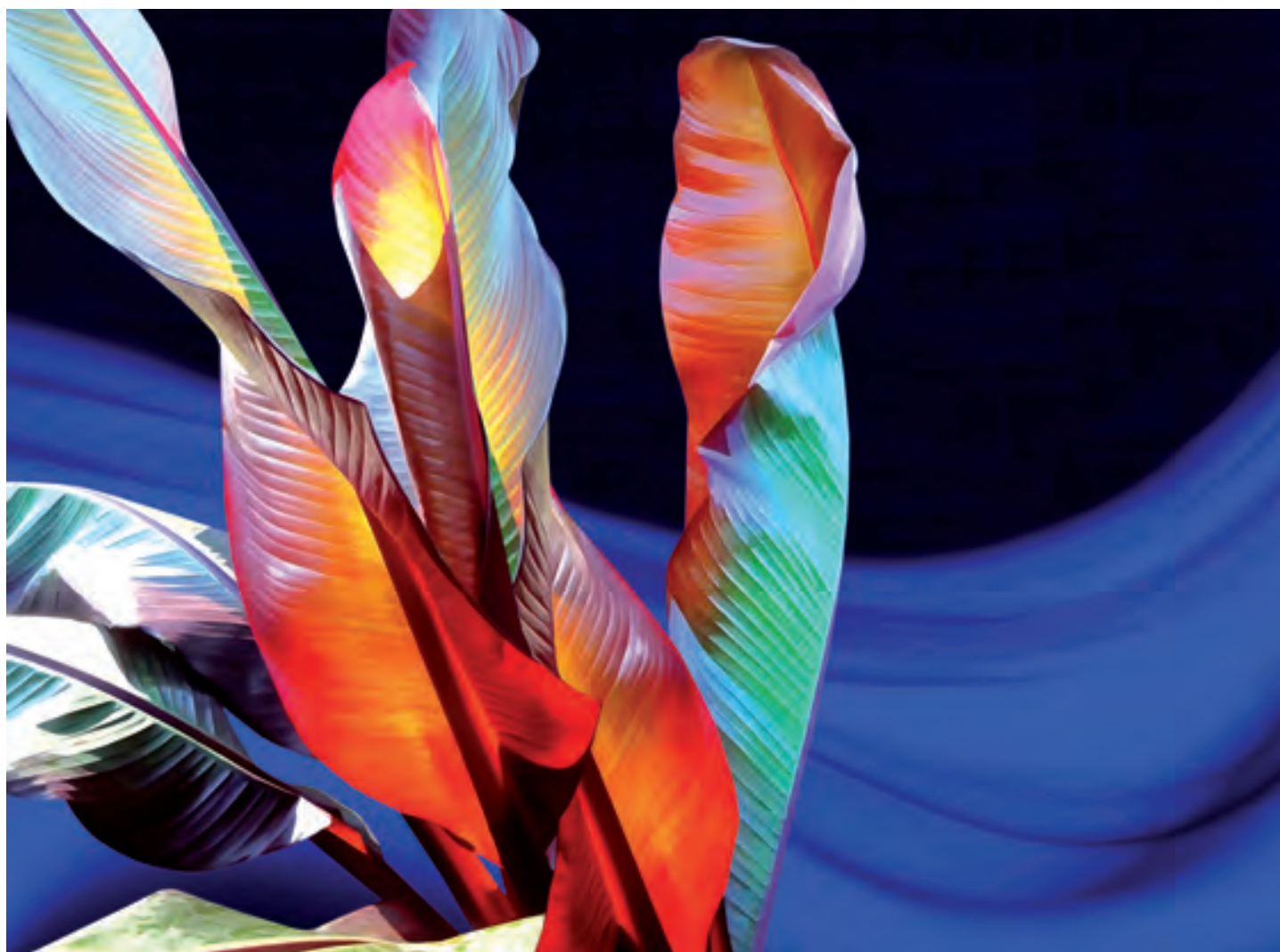
Katja Lührs; Blue Night Fog; Öl auf Leinwand, 120 cm x 90 cm, 2022 © Katja Lührs

unwiederbringlich zerstört. Irrsinniges imperiales Machtstreben bringt zudem kriegerisch Tod und Verderben hunderttausendfach über Mensch und Tier, über kollektives Leben an sich. Vor diesem Hintergrund ist Katja Lührs nicht nur künstlerisch eine Akteurin des Zeitgeschehens, sondern sie will nachhaltig und allumfassend mit ihren wunderbaren Werken die Schönheit des irdischen Lebens in unserem Denken wachhalten. Optimismus heißt daher die Devise ihrer ausdrucksstarken, nachhaltig-prachtvollen Pflanzenwelten, denn als künstlerisch gelungen apostrophiert Katja Lührs solche Werke, denen es gegeben ist, Zuversicht und Lebensfreude auszustrahlen. Wenn sie mit einer intuitiv erfahrbaren, innewohnenden Liebe ausgestattet wurden, die sich auf Betrachter überträgt und daher auch durch ihre Farbenpracht und Formen