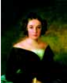
Adolph von Menzel