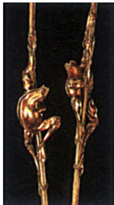
Wilfried Maria Blum

In einer Art innere Zwiesprache setzt sich Schembs mit dem Holz auseinander, bis es schließlich die Form des Kunstwerks annimmt. Seite 4