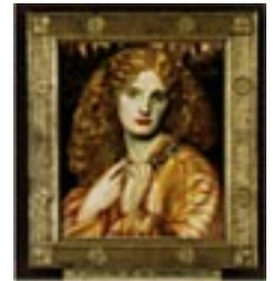
Dante Gabriel Rossetti „Helena von Troja“ Öl / Mahagoni 33 x 28 cm 1863 Kunsthalle Bremen