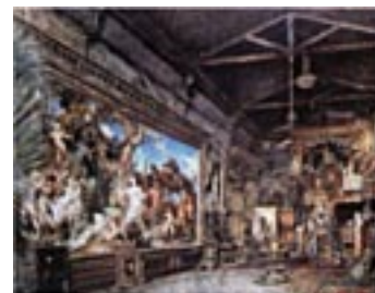
Ein Blick in das Atelier von Hans Makart, gemalt von Rudolf von Alt 1885, Historisches Museum der Stadt Wien