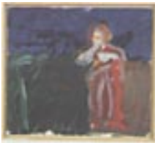
Herwig Zens „una manola“ Öl auf Leinwand 1991 40 x 45 cm