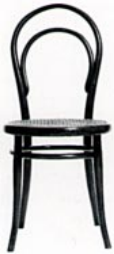
Gebrüder Thonet, Sessel Nr. 14 1859 Serienmodell