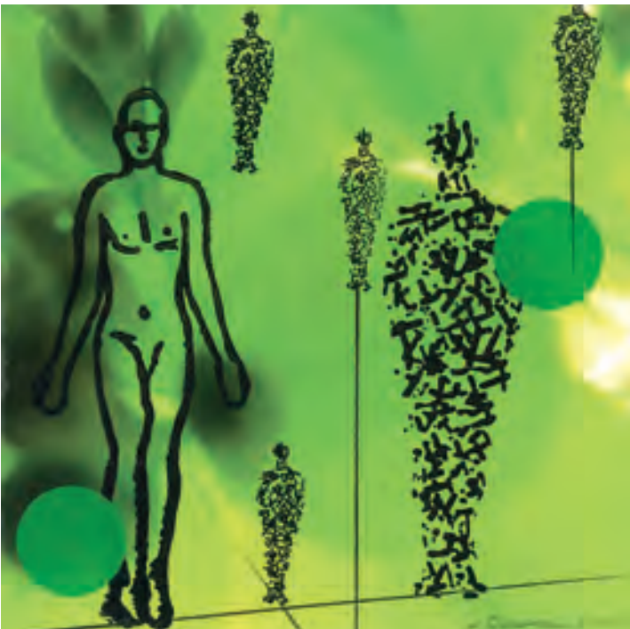
Hans Thomann; o. T.; 2013, Mischtechnik auf Papier, signiert und datiert, 20 cm x 20 cm © Hans Thomann

Sollten hier abgebildete Arbeiten bereits ihre neuen Besitzer gefunden haben, senden wir Ihnen gerne eine Auswahl vorhandener Arbeiten zur Vorauswahl per E-Mail zu. Natürlich erhalten Sie von uns auch das verfügbare Gesamtangebot unserer Künstlerinnen und Künstler.