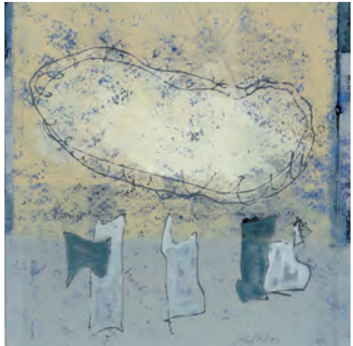
Udo Achterholt; ZKF I; 2011, Mischtechnik auf Karton, signiert und datiert, 20 cm x 20 cm © Udo Achterholt