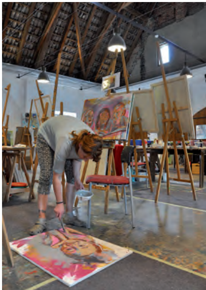
Ein freies Arbeiten inmitten einer historischen Atmosphäre - das wirkt belebend

Das Entdecken und die Weiterentwicklung eigener Fähigkeiten, ob bereits bekannt oder noch unentdeckt, wird in der Gesellschaft immer wichtiger; zumal auch die Anforderungen im Beruf stetig steigen. Der Ausgleich zwischen familiären Ansprüchen und denen des Jobs fällt zunehmend schwerer. Wir haben immer weniger Zeit und müssen uns daher genau überlegen, was wir mit unseren immer kleiner werdenden Zeitfenstern anfangen, wie wir sie nutzen wollen. Ein entspannender Ausgleich wird da umso wichtiger. Aber keine zeitliche Spanne, in der wir gar nichts tun, ist dann angesagt, sondern eher etwas, was unsere Gedanken in eine schöne, angenehme Richtung kreativen Erlebens lenkt. Auf etwas, was zu uns passt, was uns entspricht - weit weg von all dem alltäglichen, das ohnehin schon sehr viel Zeit des eigenen, wachen Lebens verschlingt. Wie wäre es mit Kunst? Die Möglichkeiten sind vielfältig, die Bildungsangebote warten. Warum also zögern? Und als kunst- und